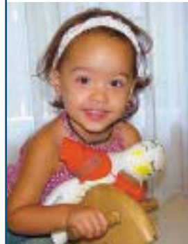
Das Puppenprojekt seit 2002: Bereits wurden über 4500 Puppen von Ki- wanis Clubs gekauft und Spitälern zur Ver- fügung gestellt. Die Kinder dürfen die Pup- pen im Spital selber bemalen. Das hilft ih- nen, den Spitalaufent- halt besser zu bewälti- gen.