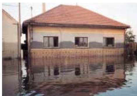
Hochwasser in Tschechien (Sommer 2002)