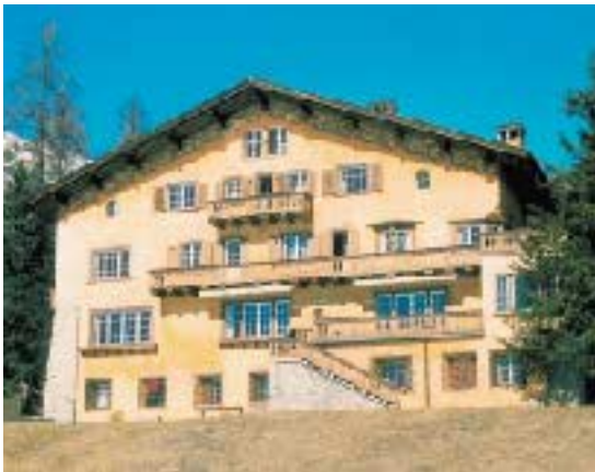
Familienferien: In Zusammenarbeit mit der Stiftung pro juventute bietet Kiwanis Familienferien an für Familien, die sich sonst keine Ferien leisten können.