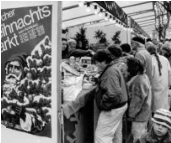
Der Zürcher Weihnachtsmarkt: 25 Jahre fand der traditionelle «Zürcher Weihnachtsmarkt» auf dem Bürkliplatz in Zürich statt.