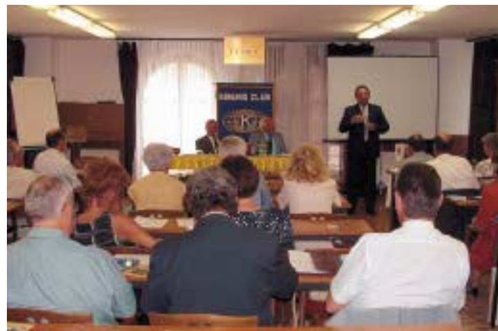
Ausbildung für Kiwanis-Amtsträger in Ungarn Formation des délégués Kiwanis en Hongrie

Mit der Errichtung des RSC in Gent im Dezember 1997 erhielt die Expansion in Osteuropa neuen Schwung. Im Jahr 2000 erreichte die Ausbreitung von Kiwanis bereits den Kaukasus und Zentralasien. Innerhalb der letzten zwei Jahre wurden 16 neue Clubs in Georgien, Kasachstan, Usbekistan und Kirgisistan errichtet.