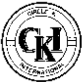
Circle K International