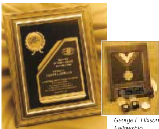
Tablet of Honor

Die Projekte können durchgeführt werden dank Spenden von Kiwanern, Clubs, Divisionen, Districts sowie externen Fonds, sowie durch den Verkauf bzw. die Abgabe von Auszeichnungen (Awards) und durch spezielle Aktionen der Stiftung.